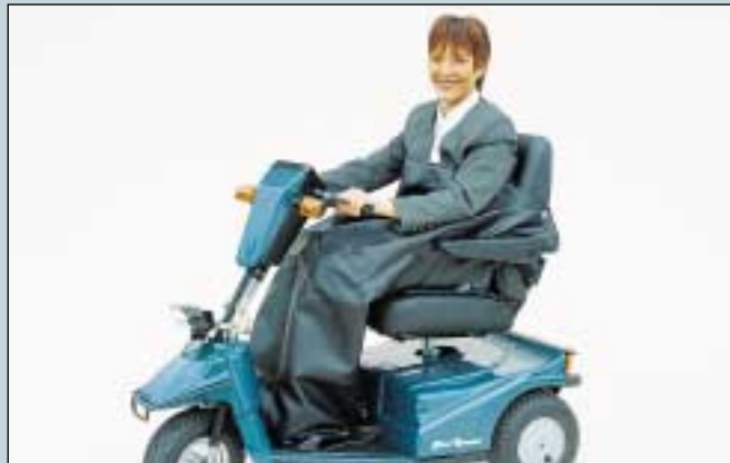
38. Wetterschutz, gefüttert. (Art. Nr. S5-0150).