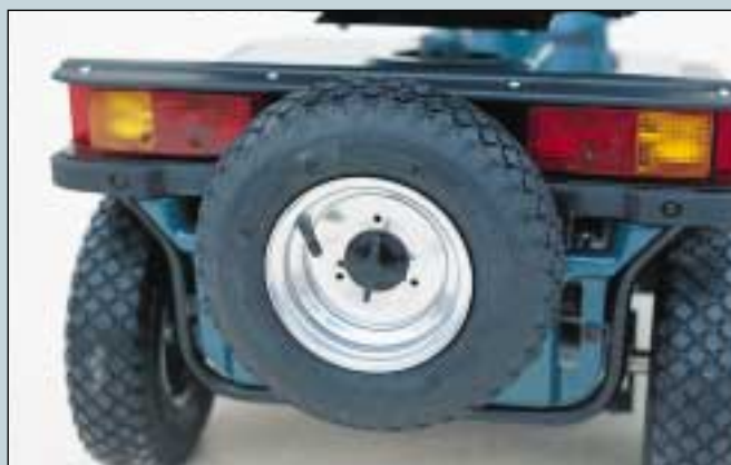
48. Reserveradhalter, hinten. (Art. Nr. S5-0205).

Sonderzubehör nach individuellen Wünschen..!