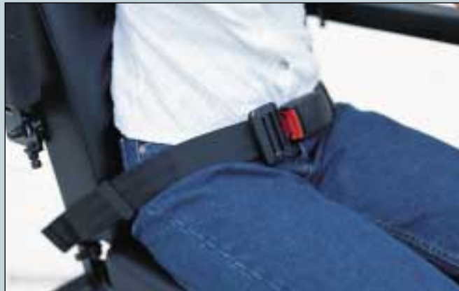
30. Sicherheitsgurt, Beckengurt. (Art. Nr. S5-0120).