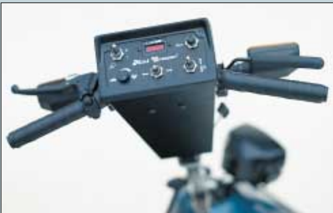
3. Steuer für Kinder. Lenker Breite 45 cm. (Art. Nr. S5-0003).