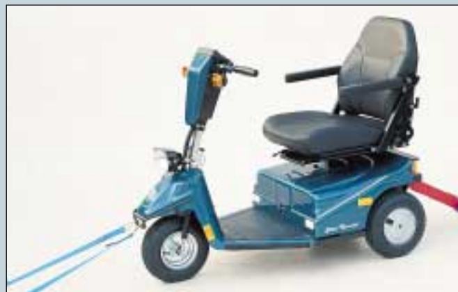
24. Gurt zur Verspannung des Mini Crosser im Auto. Length 35-68 cm. (Art. Nr. S5-0110).