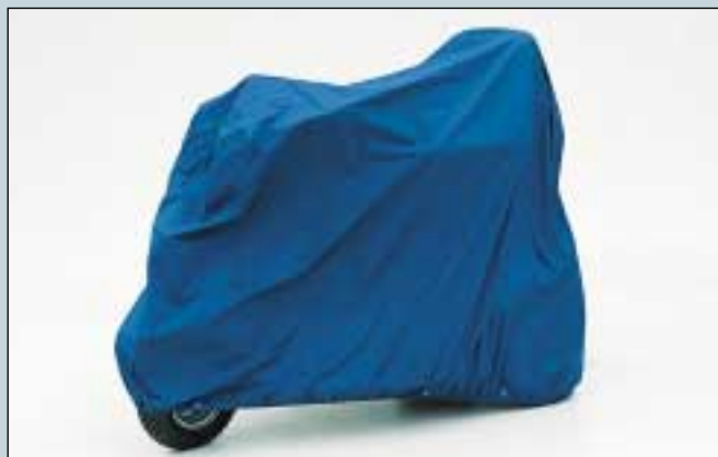
42. Abdeckplane für das ganze E-Mobil. (Art. Nr. S5-0190).