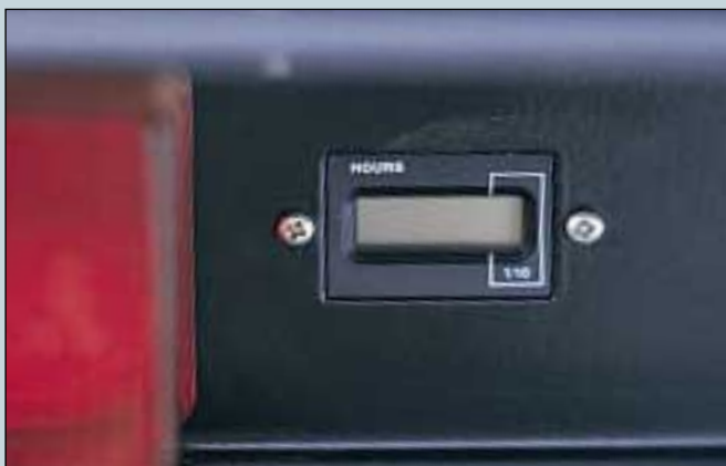
17. Stundenzähler. Hinten angebracht. (Art. Nr. S5-0315).