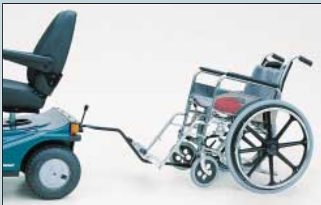
23. Rollstuhlzugvorrichtung ohne Kugelkupplung. (Art. Nr. S5-0320).