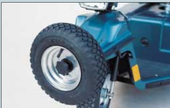
47. Reserveradhalter, vorne. (Art. Nr. S5-0205).