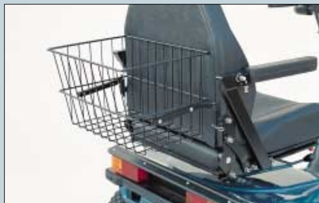
28. Korb hinten am Sitz, Anhängbar. Für alle Erwachsen-Sitze. Max. Belastung 10 kg. (Art. Nr. S5-0350). Korb hinten am Sitz, Anhängbar. Für alle Junior-Sitze. (Art. Nr. S5-0355).