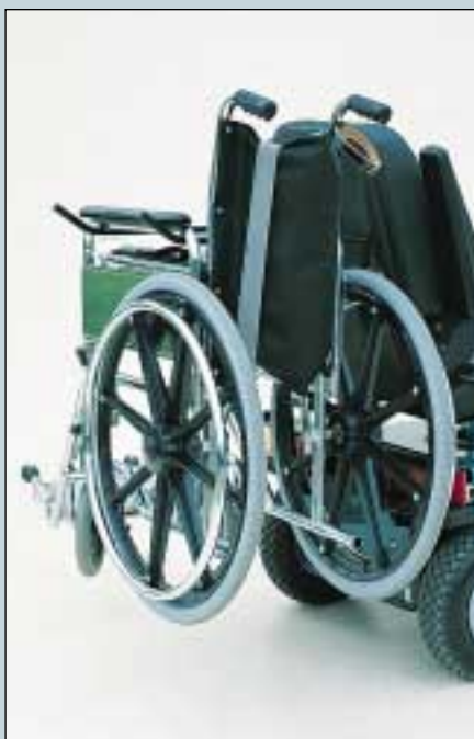
12. Rollstuhlhalter zur Heckmontage. Max. Belastung 20 kg. (Art. Nr. S5-0170).