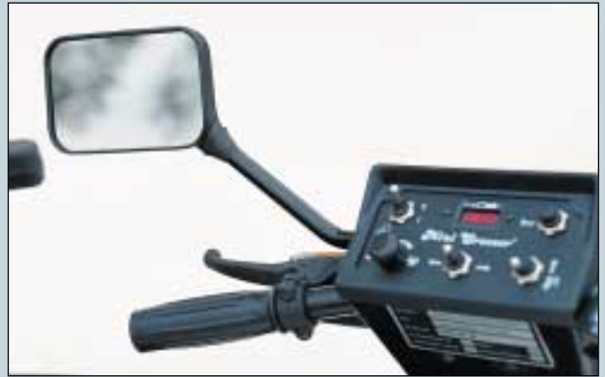
2. Spiegel, Aufschraubmontage, rechts. (Art. Nr. S5-0240). Spiegel, Aufschraubmontage, links. (Art. Nr. S5-0241).