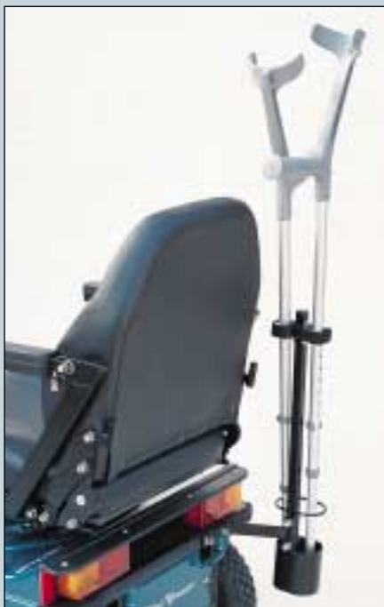
9. Gehstützenhalter für 2 Stützen. (Art. Nr. S5-0260).