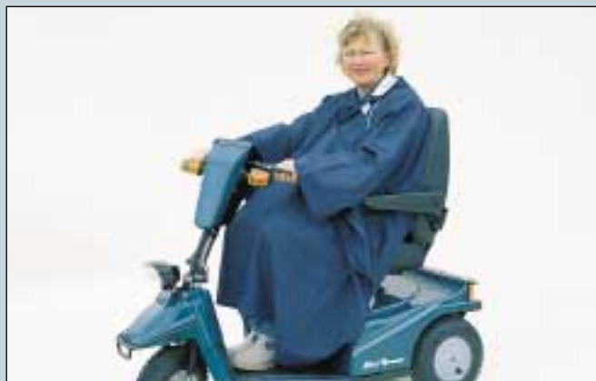
40. Regenumhang, Kinder. (Art. Nr. S5-0200). Regenumhang, Erwachsene. (Art. Nr. S5-0201).