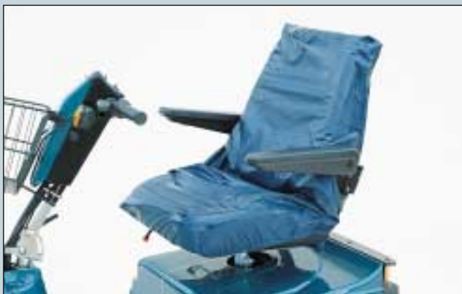
41. Sitzabdeckhaube, wasserdicht, Erwachsene. (Art. Nr. S2-0950). Sitzabdeckhaube, wasserdicht, Kind/Junior. (Art. Nr. S2-0960).