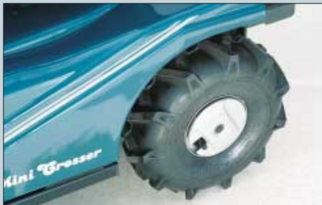
46. Hinterrad mit Geländeprofil für 125s, 130s og 140s. (Art. Nr. S4-0040). Hinterrad mit Geländeprofil und Spikes für 125s, 130s og 140s. (Art. Nr. S4-0050).