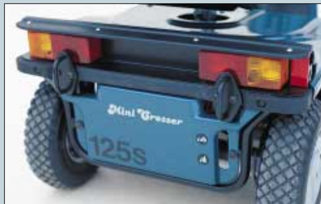
26. Transportbefestigung, extra. (Art. Nr. S5-0015).