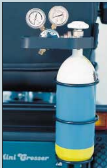
14. Halterung für Sauerstoffflasche. (Art. Nr. S5-0125).