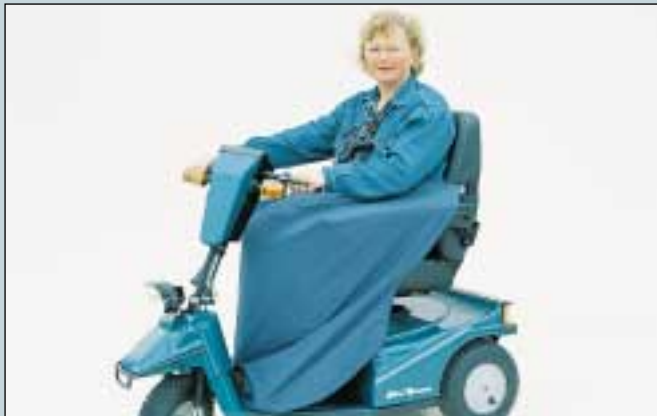
37. Wetterschutz, Thermo. (Art. Nr. S5-0145).