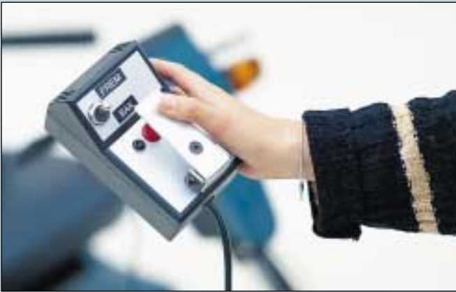
1. Fernschaltung für Mini Crosser mit Kabelverbindung. (Art. Nr. S5-0035).