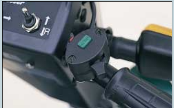
4. Blinklichtschalter - Hupeschalter für Lenker-montage. (Art. Nr. S5-0013).