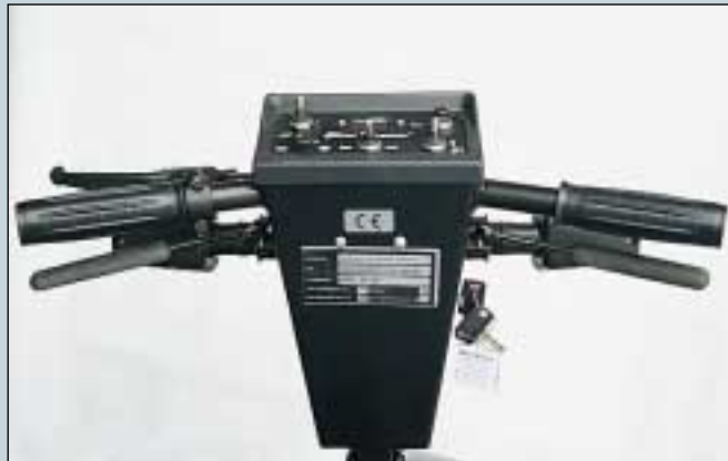
8. Kombigriff, rechts. (Art. Nr. SR-01590). Kombigriff, links. (Art. Nr. SR-01591). Standardausführung rechts.