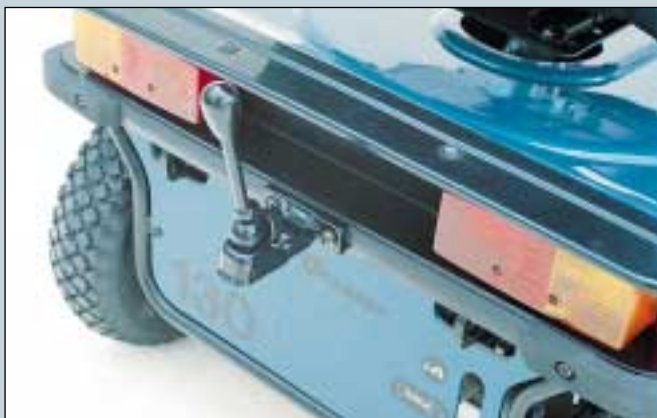
25. Kugelkupplung für Anhänger. (Art. Nr. S5-0135).