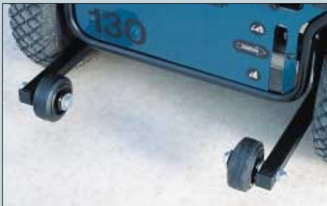
45. Zusatz-Stütz vorrichtung. (Art. Nr. S5-0290).