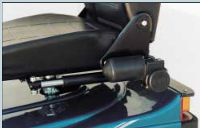
44. Elektrische Sitzverstellung, vorwärts/rückwärts, 10 cm. (Art. Nr. S2-0980).