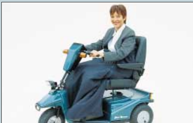
39. Winterfußsack, Wollpelz, Größe M. (Art. Nr. S5-0140). Winterfußsack, Wollpelz, Größe XL. (Art. Nr. S5-0141).