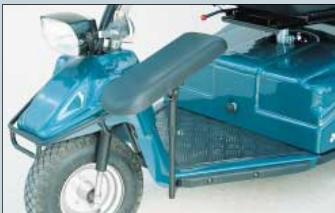
35. Beinstütze, rechts. (Art. Nr. S5-0011). Beinstütze, links. (Art. Nr. S5-012).