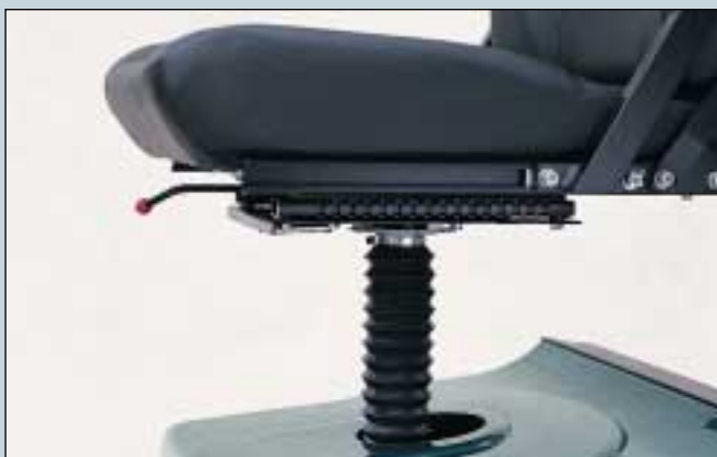
43. Elektrische Sitzhöhenverstellung, 15 cm. (Art. Nr. S2-0970).