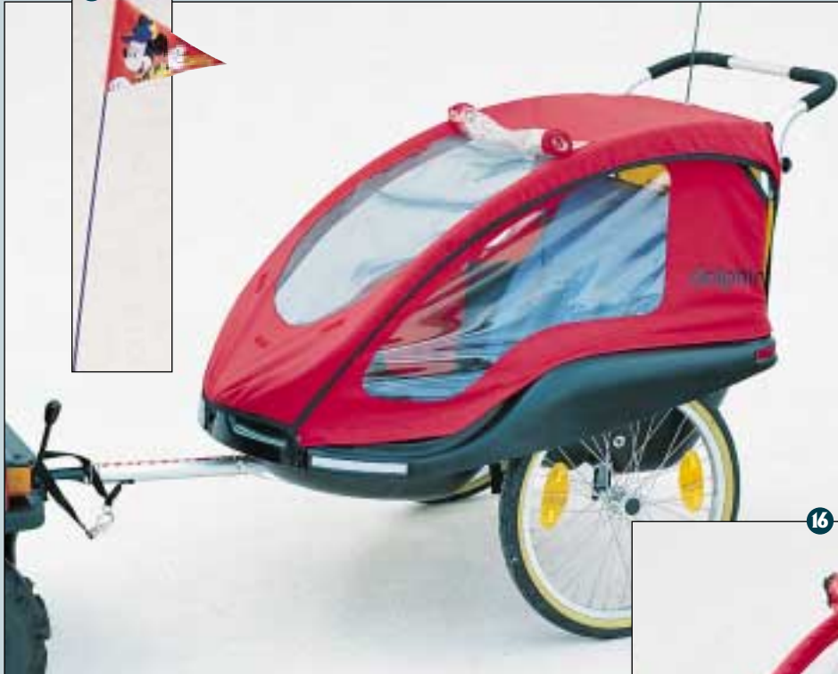
15. Kinder Fahne. (Art. Nr. S5-0004).