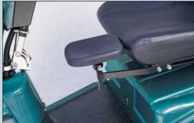
22. Amputations Beinstütze. Links oder rechts. (Art. Nr. S5-0380).