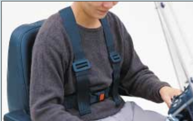
29. Sicherheitsgurt, Vierpunkt. Erwachsen. (Art. Nr. S5-0225). Sicherheitsgurt, Vierpunkt. Kinder. (Art. Nr. S5-0226).