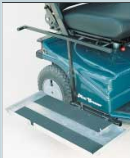
13. Faltrollstuhlhalter abklappbar zur Seitenmontage. Max. Belastung 20 kg. 125s/130s, rechts. (Art. Nr. S5-0160). 125s/130s, links. (Art. Nr. S5-0161). 140s, rechts. (Art. Nr. S5-0162). 140s, links. (Art. Nr. S5-0163). 125s/130s-4W, rechts. (Art. Nr. S5-0164). 125s/130s-4W, links. (Art. Nr. S5-0165). 140s-4W, rechts. (Art. Nr. S5-0166). 140s-4W, links. (Art. Nr. S5-0167).