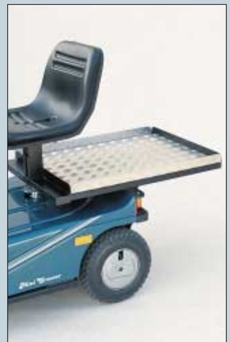
20. MC-Transporter-Sitz mit Ladefläche. Mass 54x70 cm. Max. Belastung 50 kg. (Art. Nr. S5-0365).