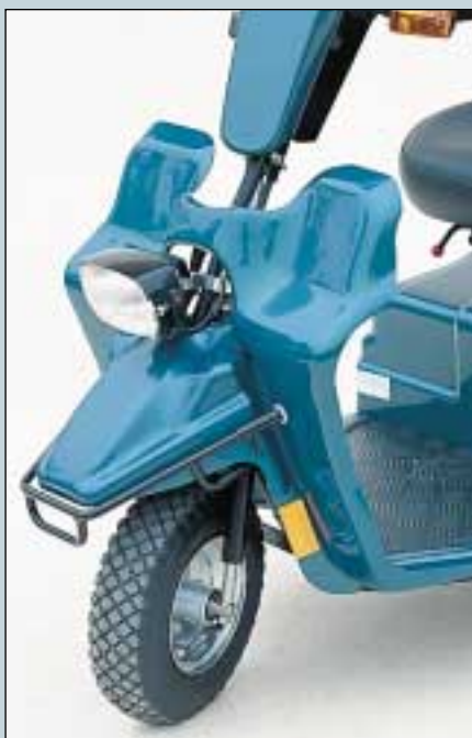
18. Beinschutzschirm. Nur ohne vordere Korb. 3-W. (Art. Nr. S5-0220). 4-W. (Art. Nr. S5-0460).