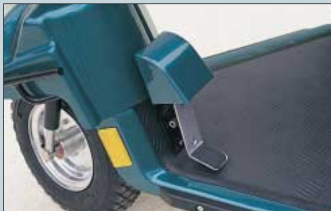
34. Fußbremse. (Art. Nr. S5-0040). Fußgas. (Art. Nr. S5-0050).