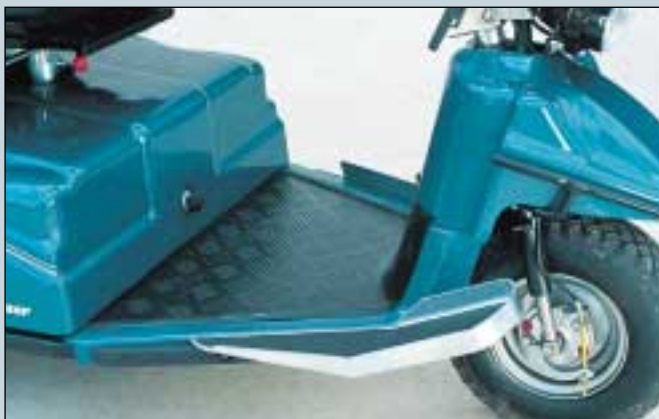
31. Fußstütze. Max. Belastung 50 kg. Rechts. (Art. Nr. S5-0070). Links. (Art. Nr. S5-0071).