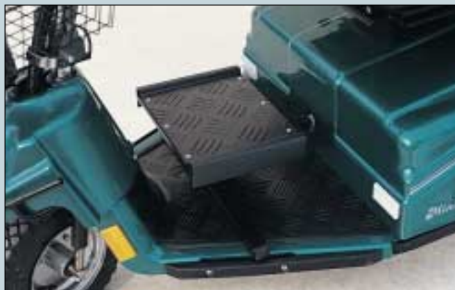
32. Fußbretterhöhung, einstellbar 3-16 cm. Max. Belastung 60 kg. 125s/130s/140s-3W. (Art. Nr. S5-0060). 125s/130s/140s-4W. (Art. Nr. S5-0061). 115s. (Art. Nr. S5-0062).