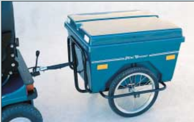
21. Anhänger - Lux ohne Kugelkupplung. HxLxB = 42x71x58 cm. Max. Belastung 70 kg. (Art. Nr. S5-0335).