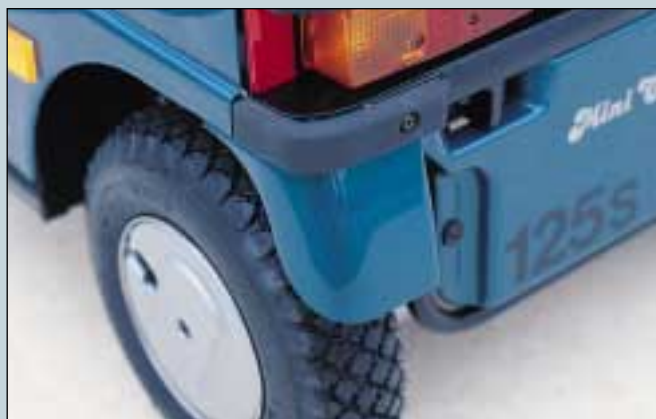
36. Schmutzfänger aus Glasfieber. 125s, 130s, 140s + 4W. (Art. Nr. SR-01586). (Standardmäßig montiert).