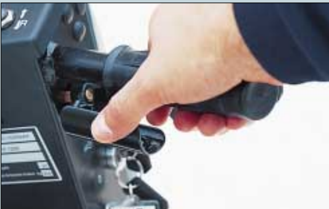
5. Gasgriff, Daumen, rechts. (Art. Nr. S5-0312). Gasgriff, Daumen, links. (Art. Nr. S5-0313).