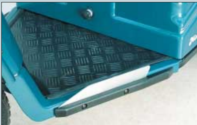
33. Fußraum - Randleiste. (Art. Nr. S5-0130).