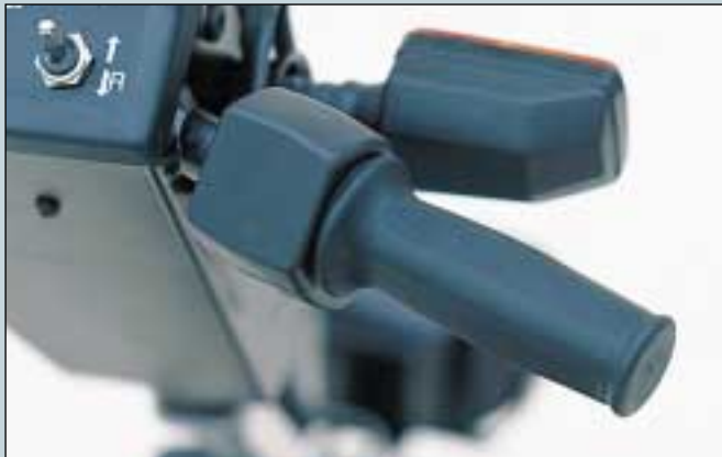
7. Drehgasgeber, rechts. (Art. Nr. S5-0020). Drehgasgeber, links. (Art. Nr. S5-0021).