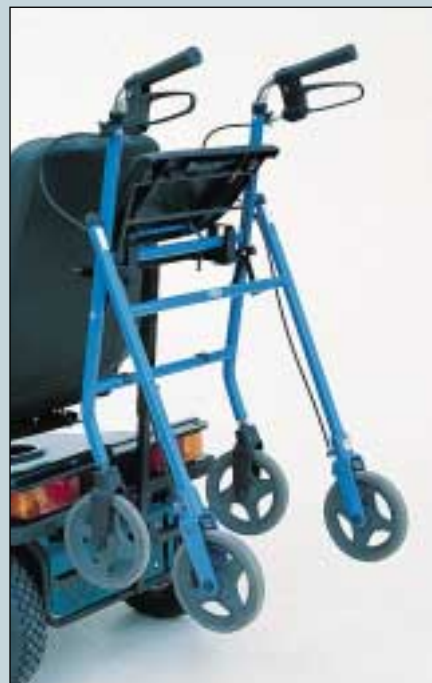
11. Rollatorhalter. Max. Belastung 20 kg. (Art. Nr. S5-0210).