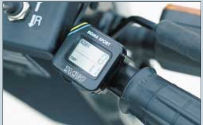
6. Tachometeranlage. (Art. Nr. S5-0230).