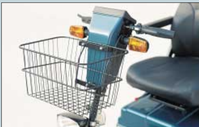
27. Korb vorne einhängbar. Standardzubehör für Mini Crosser 125s, 130s og 140s. Max. Belastung 5 kg. (Art. Nr. S5-0360). Korb für 115s. (Art. Nr. S5-0361).