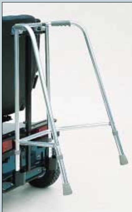
10. Gegestellhalterung. Max. Belastung 20 kg. (Art. Nr. S5-0100).